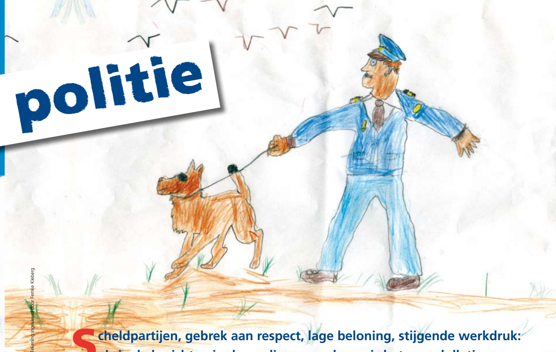
Tekening: ingekleurd door Femke Kleberg

S cheldpartijen, gebrek aan respect, lage beloning, stijgende werkdruk: als je de berichten in de media mag geloven is het geen lolletje om agent te zijn. Blauwdruk vond het tijd voor een geluid uit eigen gelederen en ging langs bij verschillende generaties blauw. Waarom wilden we ook al weer politieagent worden? En is het nog wel leuk, dit vak?