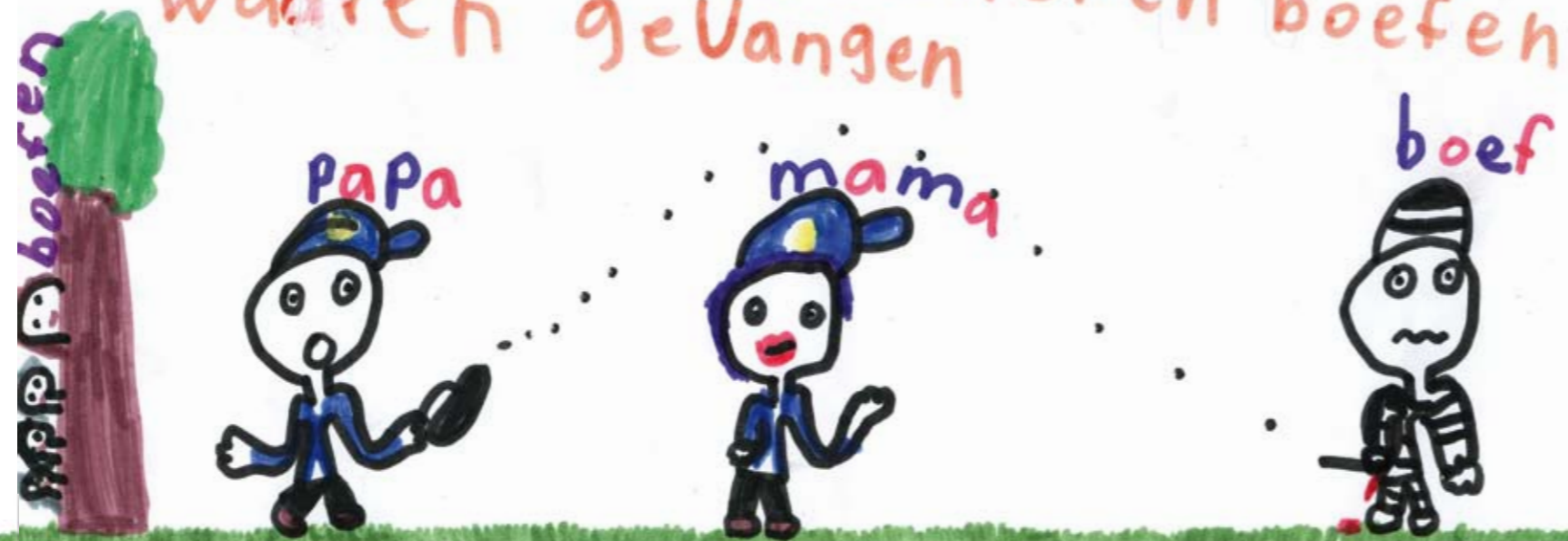
Tekening: Birke Wobbes

mama zwijdt naar de boef ze wou het naar de boef kennn. maan papa ging met de pistool schieten en de boef hat bloed. en de anderen boef waaren gevangen